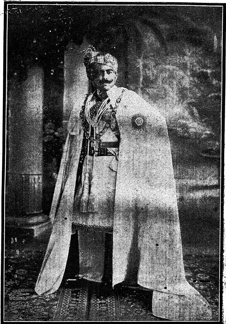
Major-General His Highness Maharajadhiraj Raj-Rajeshwar Narendra-Shiromani, Maharajah Sir Shri Ganga Singhji Bahadur, G.C.S.I., G.C.I.E., G.C.V.O., G.B.E., K.C.B., A.D.C., LL D., Maharajah of Bikaner